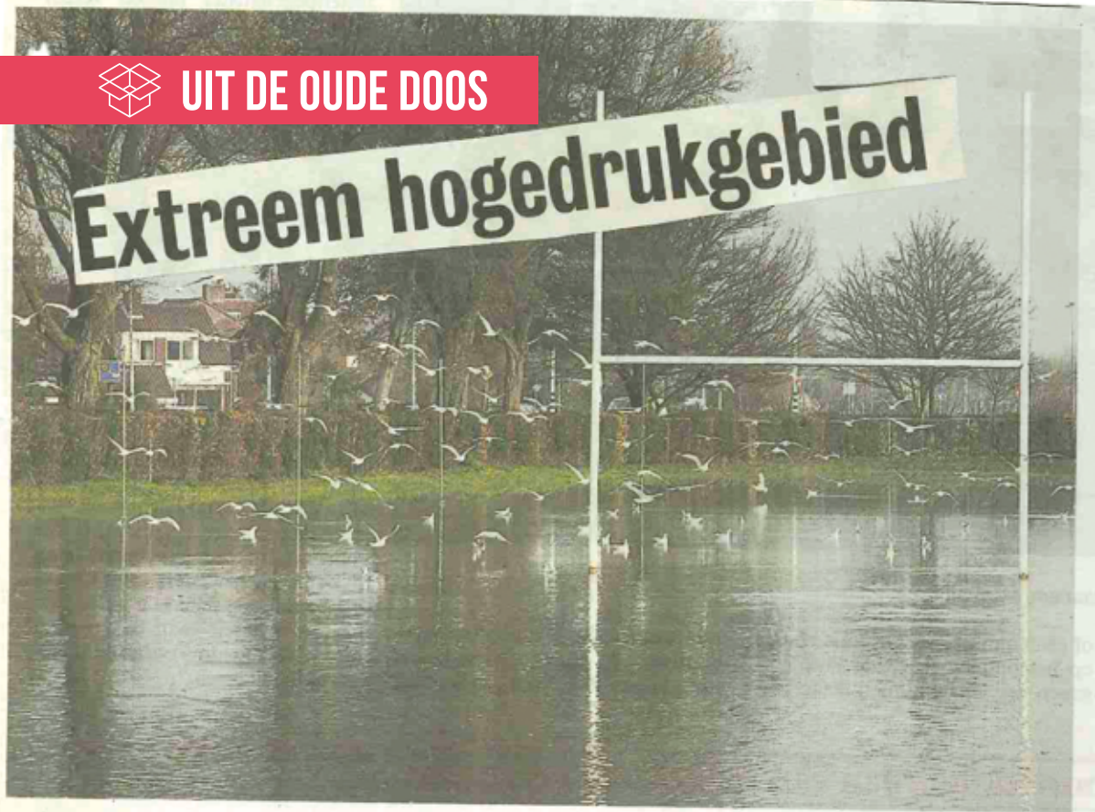
IJclub Uitgeest is er klaar voor, al is het nu nog alleen genieten voor de vogels.